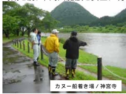
カヌー船着き場 / 神宮寺