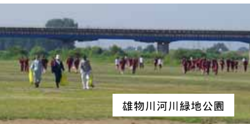
雄物川河川緑地公園