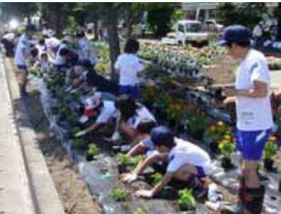
花壇に花を植える神宮寺小学校の児童