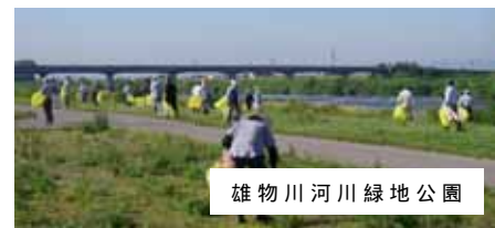
雄物川河川緑地公園

大勢の市民の方々はじめ、大曲中学校(雄物川河川緑地公園 / 約800名)、大曲南中学校(川港親水公園 / 約200名)の生徒も参加して、クリーンアップに汗を流しました。