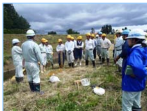
【訓練後の質疑・意見交換】