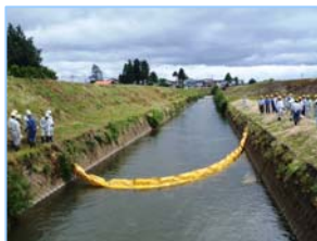
【オイルフェンス設置状況】

6月21日(木)横手市大雄の大宮川で湯沢河川国道事務所職員と維持工事業者でオイルフェンス設置訓練を行いました。冬期間に多発する油流失事故に備え、迅速に被害を最小限に食い止められるよう、実践による訓練を行いました。