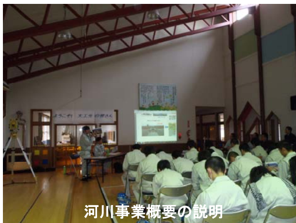
河川事業概要の説明

「樋門・樋管とはどういうものなのか?」という質問もあり、生徒達は、説明に熱心に耳を傾けたり、普段、学校ではなかなか体験できない生の工事作業現場を満喫していました。