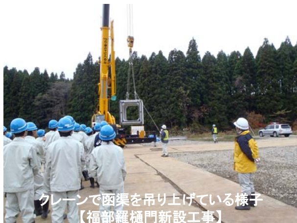
クレーンで函渠を吊り上げている様子 【福部羅樋門新設工事】