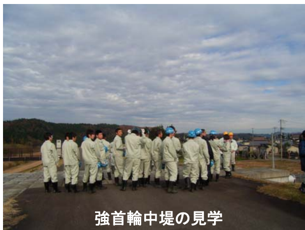
強首輪中堤の見学