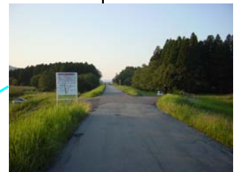
通行止め道路迂回路入口の様子