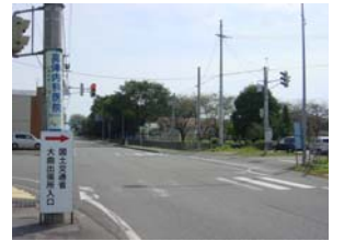
大曲出張所入り口（金谷交差点）の様子 大曲出張所へご利用の方は、こちらの道路を通ってお越しください。