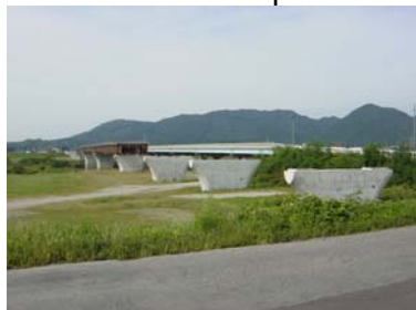
現在建設中の大曲橋の様子