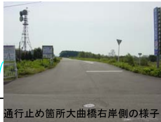
通行止め箇所大曲橋右岸側の様子