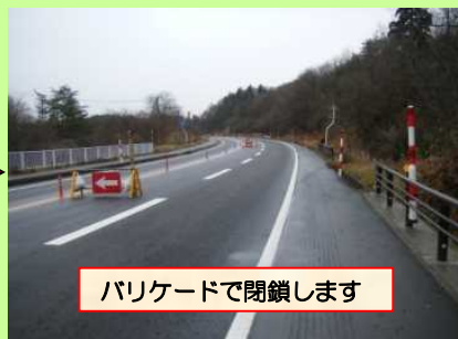
バリケードで閉鎖します