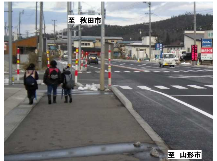
歩道拡幅後、完成状況 (R3完成箇所)