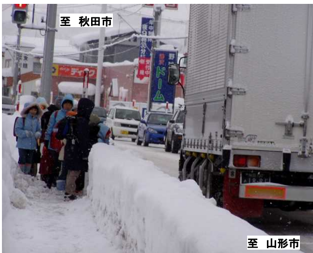
積雪時の歩道狭隘状況