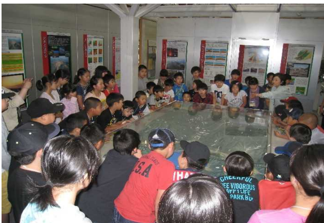
秋田駒ヶ岳火山防災ステーション