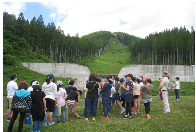
供養佛沢砂防堰堤