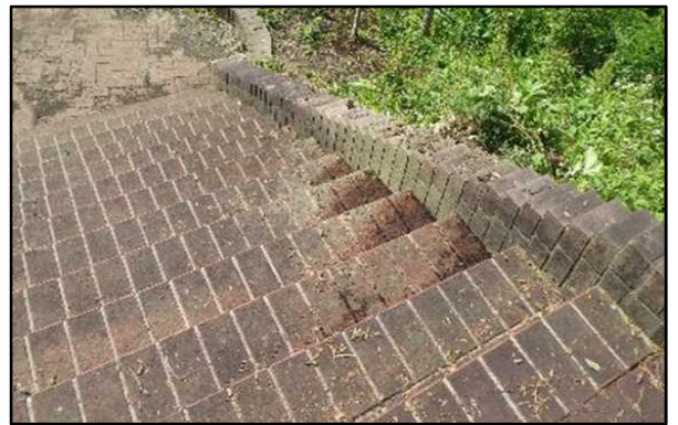
○植物を伐採しました

〈能代市：ニツ井町荷上場地区（ニツ井地区桜づつみ）（米代川：能代河川国道事務所）〉