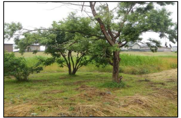
○枝を伐採しました