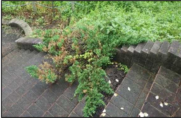
●階段への植物飛び出し