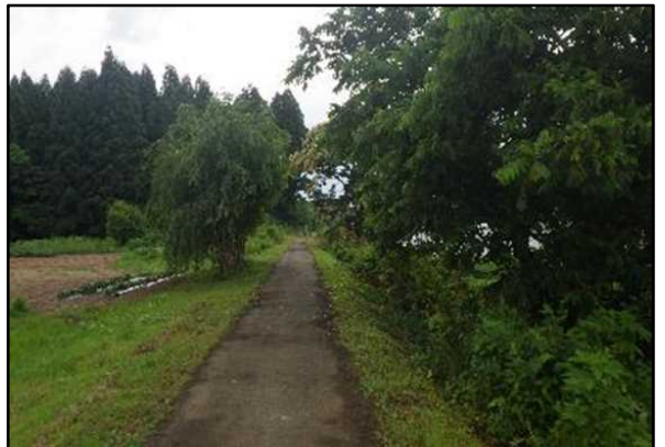
○枝を剪定しました