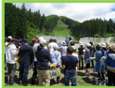
供養佛沢砂防堰堤