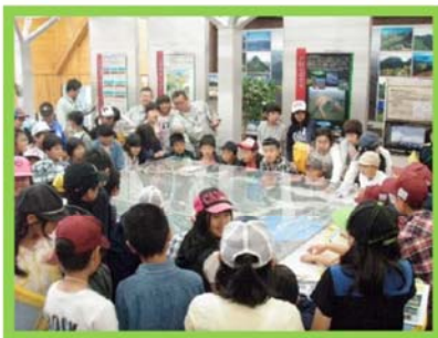
秋田駒ヶ岳火山防災ステーション