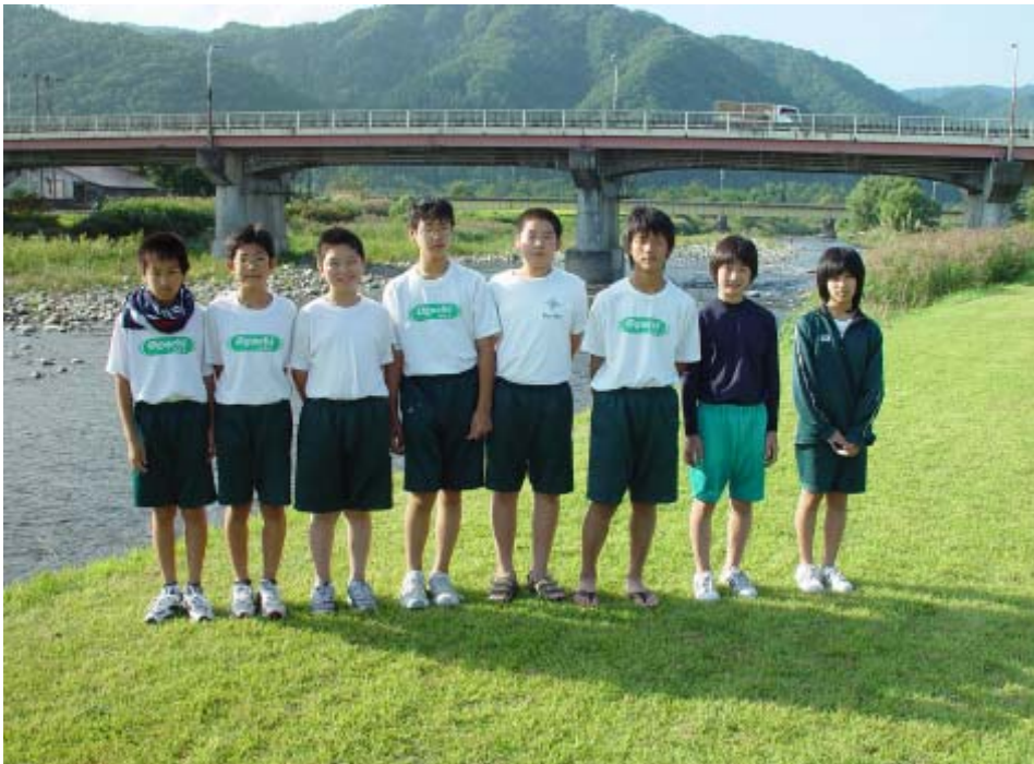
☆ 最後に記念撮影（川って面白い） ☆