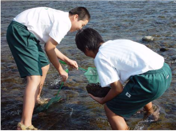
☆おい、この石にいっぱい何かついてるぜ！☆