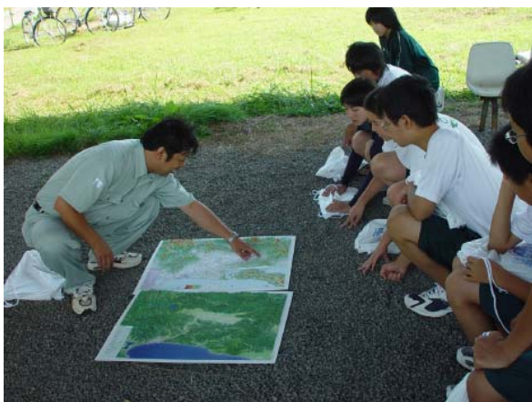
☆ 立体地図で役内川の位置を確認 ☆

生徒さんからは「川の生き物は芋虫みたいなのが多くて気持ち悪いが、こんなに多くの生き物がいることがわかった」「現在の役内川はきれいだが、ゴミや家庭の雑排水が川を汚すので、みんなで川をきれいにするためゴミや排水を少なくするよう心がける」などの感想、決意がありました。