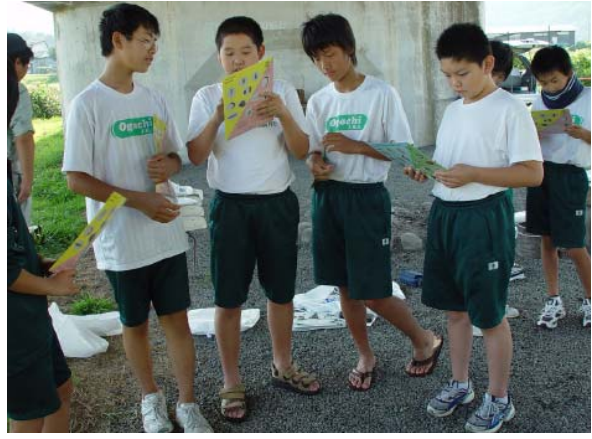
☆ あの虫はこれじゃないかな？ ☆