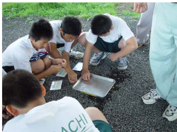
☆ 役内川はとってもきれいでした ☆