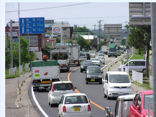
▲バイパス開通前の国道13号(現道)