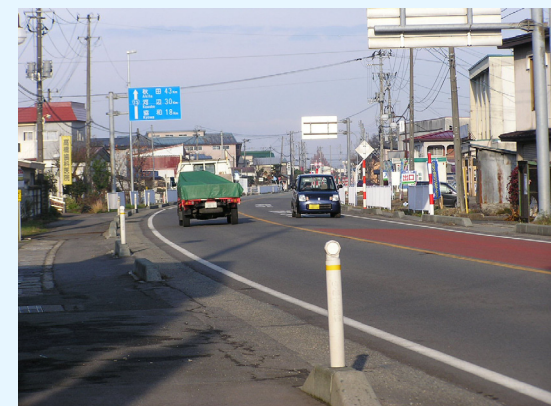
▲バイパス開通後の国道13号(現道)