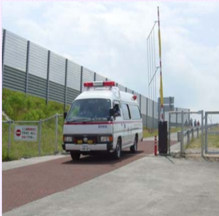
▲湯沢横手道路の救急車退出路を利用する救急車