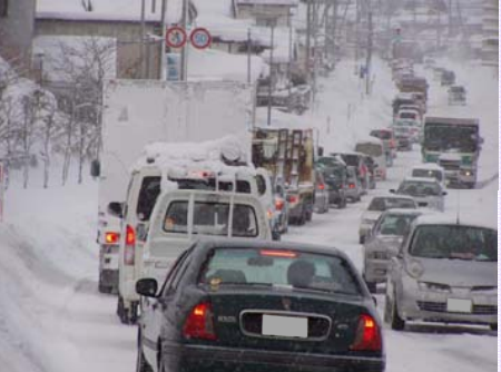
▲冬期間、悪化する渋滞