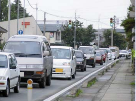
▲国道13号の渋滞状況