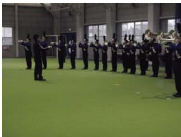
センセーショナルジップによるオープニング演奏