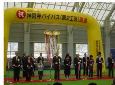
テープカット及びくす玉開披