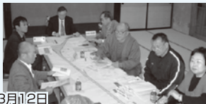
地元懇談会の様子