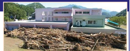
平成28年台風10号により、岩手県の要配慮者利用施設では利用者9名の全員が死亡。