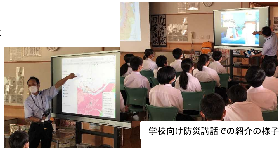
学校向け防災講話での紹介の様子