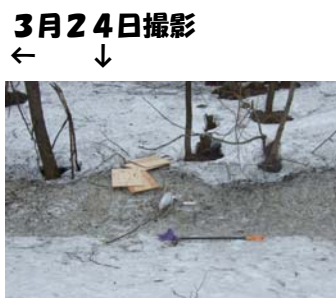
3月24日撮影 ← ↓