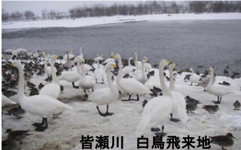
皆瀬川 白鳥飛来地

平成20年になり今年の冬は今年の暖冬とは違い、正月早々の降雪で皆さん大変だったと思います。 十文字出張所では1月31日現在に発注された工事はNo. 162号にてお知らせした10件のほか、さらに2件追加となり計12件となっております。 出張所では安全・迅速に工事が進むよう施工業者と共に施工に望んでおります。また、河川工事に関して何かございましたら十文字出張所にご連絡下さい。