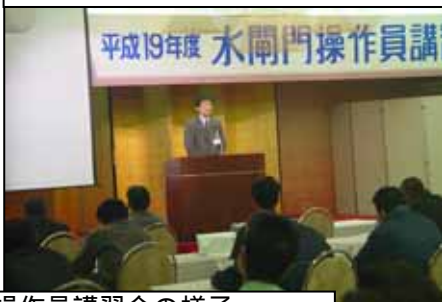
操作員講習会の様子