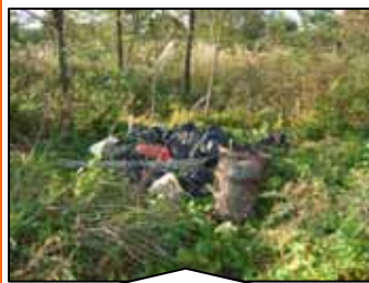
湯沢市中川原 (文月橋上流)