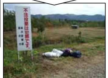
横手市十文字町 (今泉橋下流堤防)