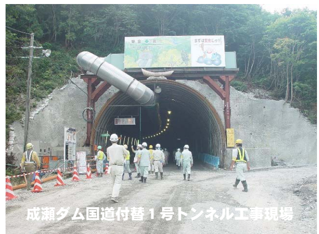
成瀬ダム国道付替1号トンネル工事現場