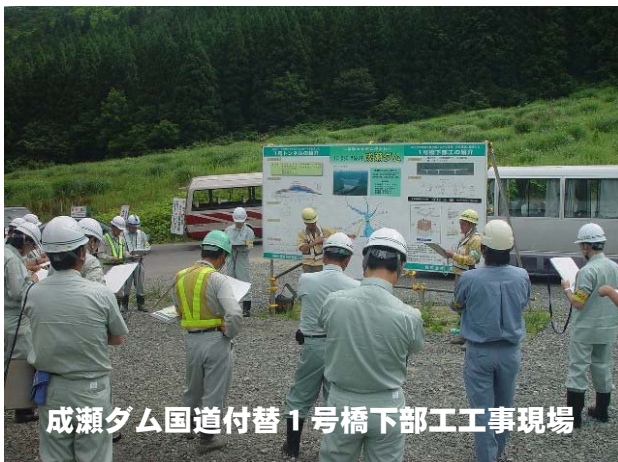
成瀬ダム国道付替1号橋下部工工事現場

午前中には、成瀬ダム国道付替1号橋下部工工事(東成瀬村)、成瀬ダム国道付替1号トンネル工事(東成瀬村)の現場を点検し、午後からは点検結果や対応策の検討を行いました。その後、横手労働基準監督署の方から講話をいただき、参加者は労働災害発生状況、労働災害防止対策等について熱心に聞きっていました。