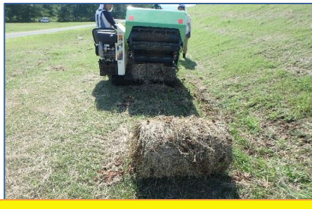
梱包機械を使って集積している様子