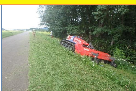
ラジコン式の機械で除草している様子