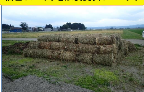
梱包した刈草を無償提供しています