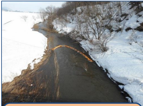
事故処理例① オイルフェンス設置 (処理費用は原因者が負担)

万が一、油流出事故を起こしてしまったり発見したときは、お近くの警察署、消防署、各市町、または十文字出張所までご連絡ください。