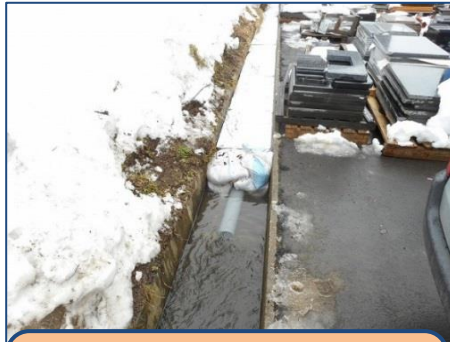
事故処理例② オイル吸着マット設置 (処理費用は原因者が負担)