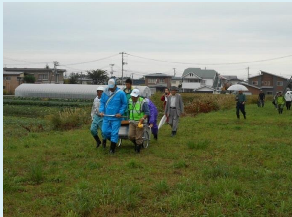
町内ごとに避難している様子