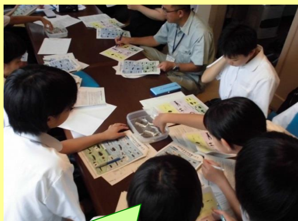
どんな生物がすんでいるの？

雄物川・皆瀬川など横手市を流れる川について調べ、その豊かさを発信するとともに、川の環境を守るためにできることを考えました。