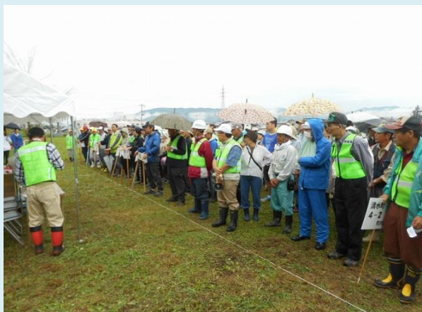
訓練に参加した地域住民

参加した、岡田町、清水町、両神の皆さんは、非常用の袋を背負い、洪水や地震等の災害に備えて地域一体となって避難経路や避難場所の再確認を行いました。