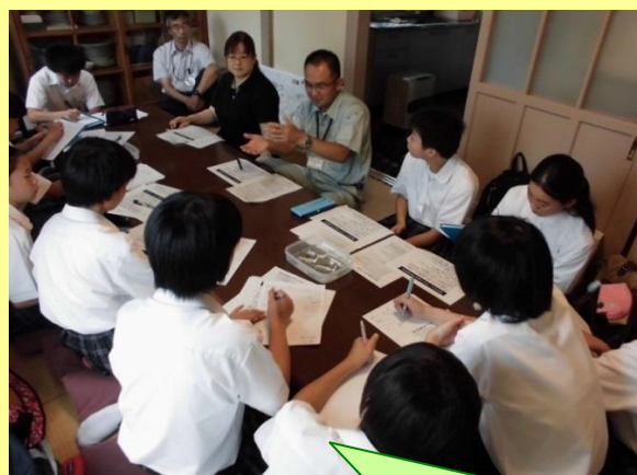
途切れることなくインタビュー！😊