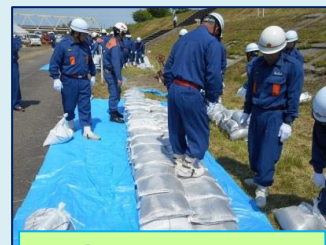
改良積み土のう工法