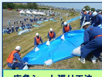
応急シート張り工法