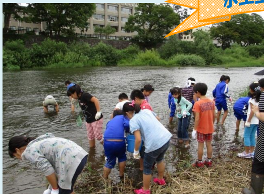
水生生物調査の様子

9月9日(水)、横手川の蛇ノ崎橋付近で横手市立横手南小学校4年生26名の児童たちが、川に棲む水生生物や、簡易水質試験により、川の水質などを学習しました。いろいろな生物との出会いに大きな歓声を上げながらの学習となりました。