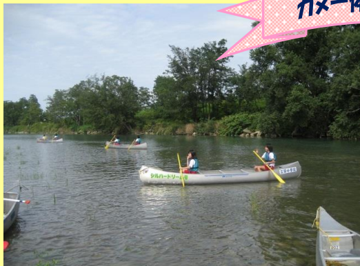
カヌー体験教室の様子