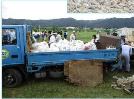
クリーンアップで集められたゴミの一部

7月20日(月)、「雄物川クリーンアップ協議会」の呼びかけで、雄物川一斉クリーンアップが湯沢市山田地内で行われました。