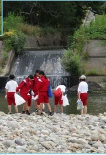
クリーンアップの様子