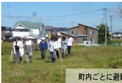
町内ごとに避難している様子

今年は勢力の強い台風が多発しており、各地で甚大な被害が発生しています。もしもの時に備え、皆さんも日頃から避難経路や避難先等を確認しておきましょう！