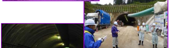
下院内トンネル工事 現場見学の様子 (湯沢市下院内地内)