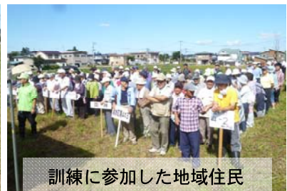
訓練に参加した地域住民