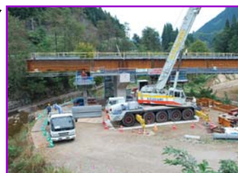
新雄勝川橋上部工工事 現場見学の様子 (湯沢市上院内地内)

見学会では、橋の桁を架ける作業を間近で見学したり、トンネルの最先端部を見学しました。