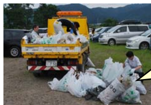
集められた ゴミの一部