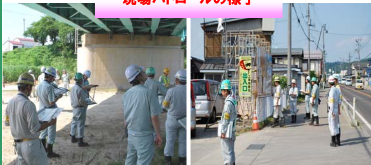
現場パトロールの様子

パトロール終了後は、検討会を開催し、参加者による点検結果を基にして労働災害や事故の防止などについて、発注者受注者を問わず、様々な視点から改善すべき点の対策等を検討しました。