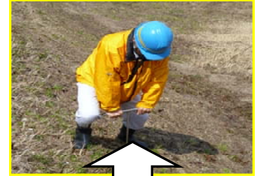
堤防の強度を測定している様子

今回の点検で緊急を要する大きな問題は確認されませんでした。洪水に備え適切に管理していきたいと思えます。