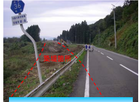
交通規制を予定している 羽後町鶴巣地内の築堤工事箇所

また、工事場所周辺地域の皆様へはご迷惑、ご不便おかけしますが、ご理解・ご協力下さるようお願いいたします。