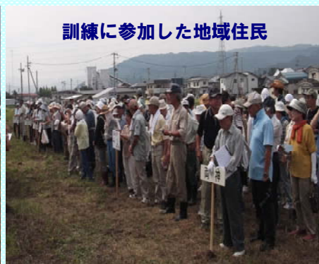
訓練に参加した地域住民