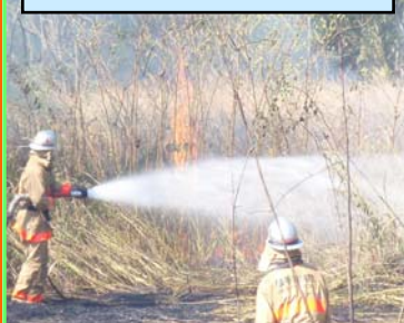
9月18日発生 横手市十文字町

野焼きが原因で、堤防の芝が焼けるなど河川管理施設が損傷したときは、行為者に原状回復費用を求める場合があります。堤防付近での野焼きは絶対に行わないで下さい。