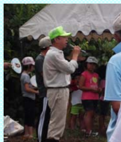
← 守る会 奈良会長