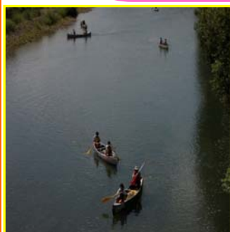
カヌー体験教室の様子

当日は、三関小学校の5年生(18名)と6年生(15名)が参加し、上ノ宿橋の下流まで雄物川を下りました。天候に恵まれ、5・6年生の皆さんはカヌー操作に悪戦苦闘しながらも、元気にクルージングを楽しんでいました。