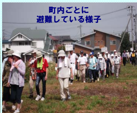
町内ごとに 避難している様子