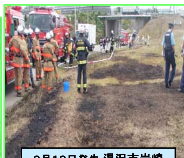
9月18日発生 湯沢市岩崎