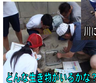
どんな生き物があるかな？