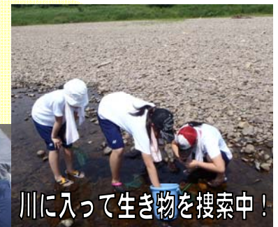
川に入って生き物を検索中！