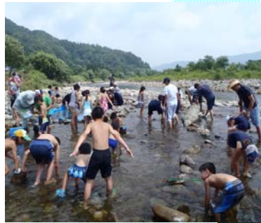
小野地区 川遊び体験教室の 様子

学習会では、国土交通省湯沢河川国道事務所職員の説明を聞き、ヒラタカゲロウやカワゲラなどの川虫はきれいな水にすむことや川の大切さを学びました。