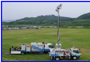
排水ポンプ車と照明車 展示の様子

当日は、国土交通省所有の排水ポンプと照明車を展示し、機械の構成や活動状況の紹介がされ、また消防本部、各地域の消防団が参加し水防工法訓練が行われました。