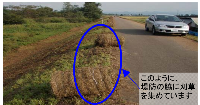
このように、 堤防の脇に刈草 を集めています