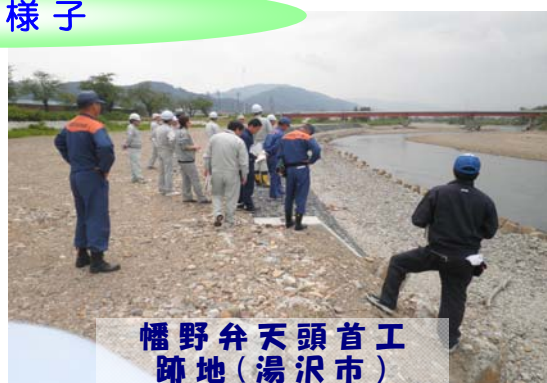
幡野弁天頭首工 跡地(湯沢市)