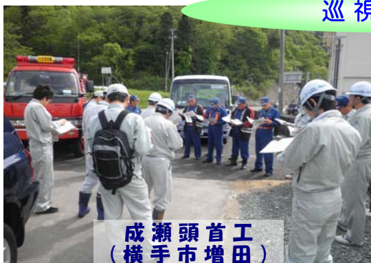
成瀬頭首工 (横手市増田)