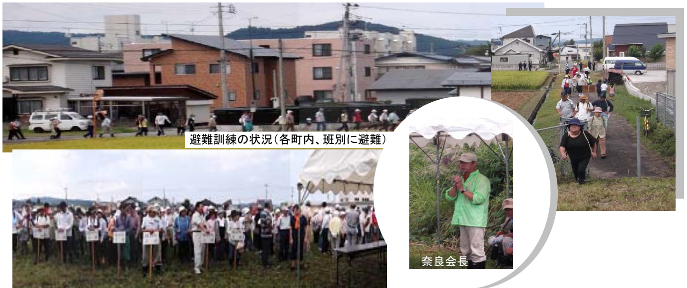
避難訓練の状況(各町内、班別に避難)