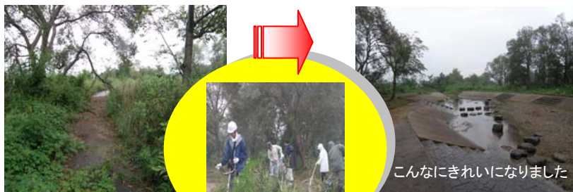
こんなにきれいになりました

湯沢市の松の木河川公園に隣接する「水辺の楽校」において、湯沢市に支社を持つ(株)ウマ地域総研(本社:秋田市)の皆さんが、9月10日(土)ボランティアで昨年に引き続き除草作業をしてくれました。