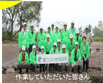
作業していただいた皆さん