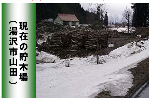
現在の貯木場 （湯沢市山田）