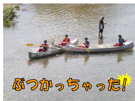
ぶつかっちゃった!