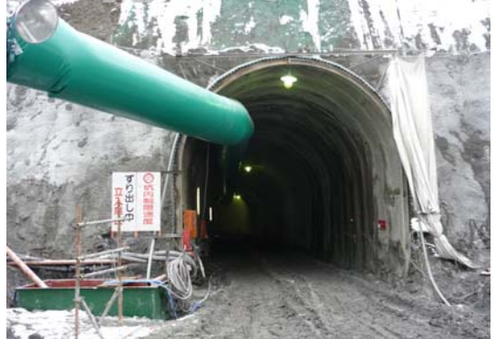
転流工工事現場の様子

そして今後一層の工事現場での安全確保、安全作業を心がけていくことを再確認しました。