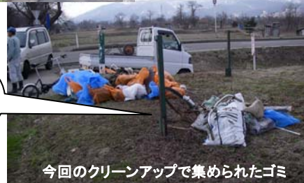
今回のクリーンアップで集められたゴミ