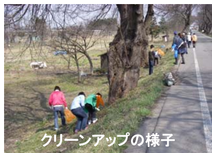
クリーンアップの様子