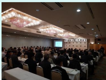
真剣な面持ちで講習会に参加する観測員

講習会では今年度から採用された観測員も含め、河川の水位上昇の際、水門等の操作や、毎月の点検時の留意点の説明を受け、水門等水位観測員としてのスキルアップに努めていただきました。