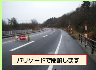
バリケードで閉鎖します