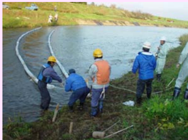
オイルフェンス設置の様子

油流出事故を起こした場合、原因者の負担になりますので、日頃からの注意をお願いします。