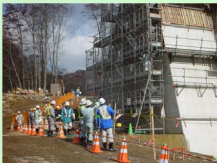
現場パトロールの様子

検討会では、現場の問題点を話しあいました。今回のパトロール結果をもとに、各自の現場における今後の安全対策の徹底に努めてもらいたいと思います。