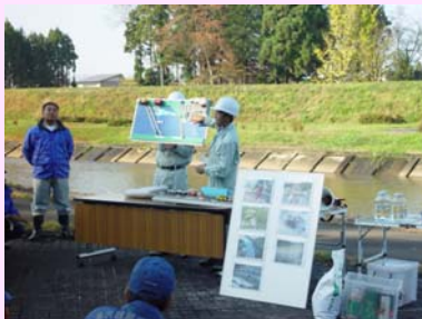
油事故対応時の説明の様子