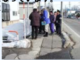
歩道の現地点検の様子

そこで、改良計画に意見を反映するため合同点検を行い、現状の問題について意見交換を行ったものです。現地点検では実際に問題となっている現場を歩き状況を確認しました。