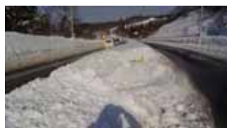
雪提で壁を作ります

普段は近くで見ることの出来ないグレーダーや除雪トラックを見学したり、ロータリー除雪車に体験試乗したりと貴重な時間を過ごしていただけたと思います。