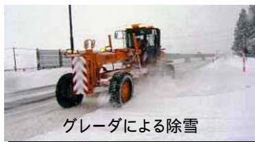
グレーダによる除雪

本格的な除雪作業が始まる前に大曲国道維持出張所では、11月14日(水)神岡除雪ステーションにおいて一般国道13号(横手市安本～大仙市協和字上淀川 L=42.1km、神宮寺パイパス一部供用L=2.6km)の、除雪出動式が行われました。関係者約30名が出席し、安全を祈願した後、除雪機械の安全点検を行い、異常がないことを確認し除雪機械が神岡除雪ステーションを出動しました。