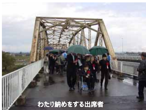
わたり納めをする出席者