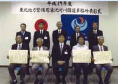
【東北地方整備局長表彰】

7月20日(金)、長年にわたり樋門樋管等の操作に従事しておられる方々の表彰式が、湯沢河川国道事務所会議室でおこなわれました。大曲出張所管内では、局長表彰を4名の方が、事務所長表彰を3名の方が受けられました。