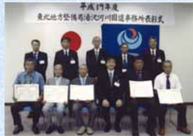
【湯沢河川国道事務所長表彰】