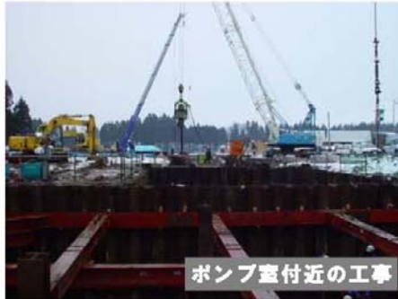
ポンプ室付近の工事

厳しい冬場の工事ですが、1日も早く安全に工事を進めるよう努力しておりますので、皆さまのご理解、ご協力のほどよろしくお願いいたします。