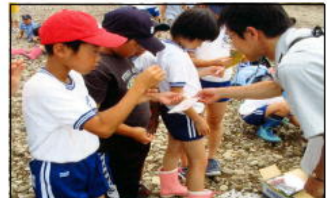
試薬での水質調査