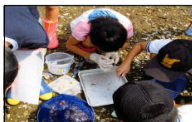
捕まえた生き物を識別しています