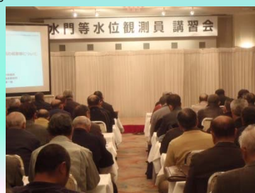
真剣な面持ちで講習会に参加する観測員

講習会では今年度から採用された観測員も含め、河川の水位上昇のさいの水門等の操作や毎月の点検時の留意点の説明を受け、水門等水位観測員としてのスキルアップに努めていただきました。