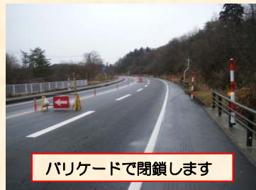
バリケードで閉鎖します